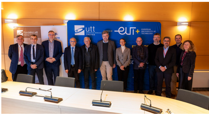
18 décembre 2023 - Signature de la Convention de partenariat UTT - La Poste