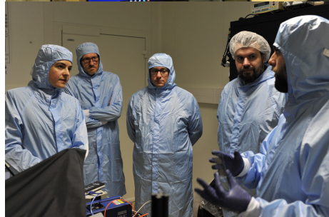
Visite de Madame Cécile Dindar, Préfète de l'Aube UTT 30 janvier 2024