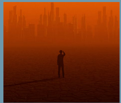
Les cybercriminels agissent en bandes très organisées, et surtout très modulables.

Un article de Jean-Yves Marion, Directeur du Laboratoire Loria de l'Université de Lorraine.