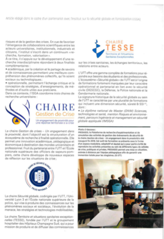
Revue DefTech - N° 07-2023 et N°08-2024

La sécurité globale vise à identifier et à comprendre les interactions entre l'homme, l'environnement et la technologie pour anticiper les risques, non encore ou faiblement connus, du monde moderne et de la sécurité.