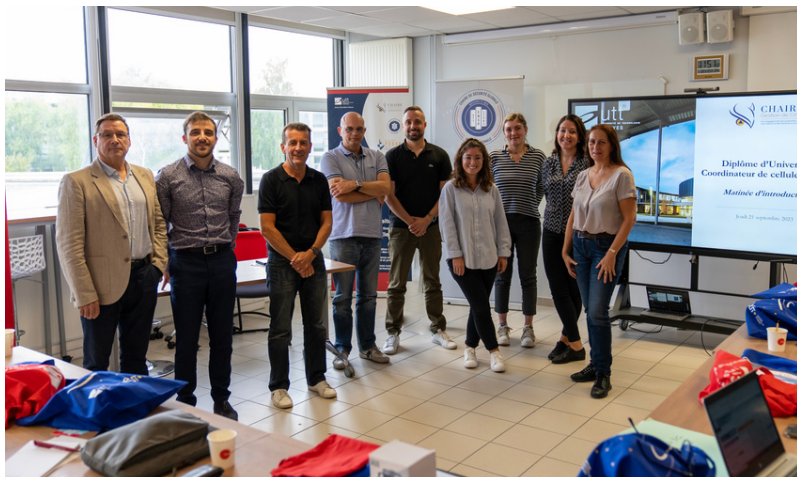
Promotion 2023-2024 - DU Coordinateur de Cellule de Crise UTT

Plus d'informations : https://www.utt.fr/formations