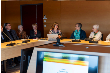
UTT - Visite SMLH - 11 avril 2024