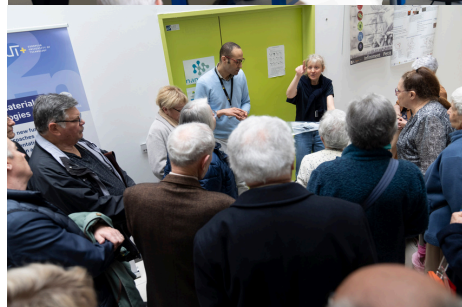
UTT - Visite SMLH - 11 avril 2024

L'Institut sur la Sécurité Globale et l'Anticipation (ISGA) a eu le plaisir de recevoir le 11 avril 2024 la Société des Membres de la Légion d'honneur (SMLH) de la Section de l'Aube au sein de l' Université de Troyes (UTT) .