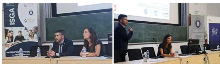
Conférence "Dérives sectaires : le Continuum Public-Privé" ENSP Cannes-Ecluse - 21 mai 2024

La Chaire Sécurité Globale , en collaboration avec l' Ecole Nationale Supérieure de la Police (ENSP) , et l' ISGA , organisait le 21 mai dernier une conférence, sur le site de l'ENSP de Cannes-Ecluse , dédiée à la lutte contre les dérives sectaires .