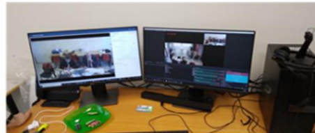
Salle de régie